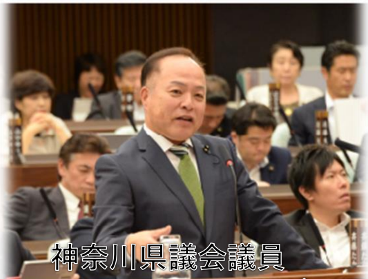
神奈川県議会議員